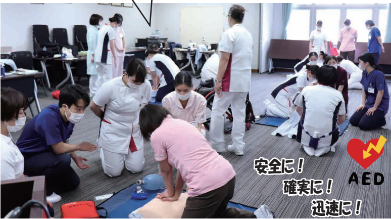
安全に！ 確実に！ 迅速に！ AED