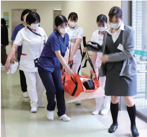
軽々搬送できました！