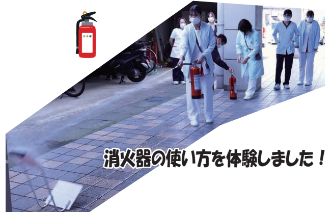
消火器の使い方を体験しました！