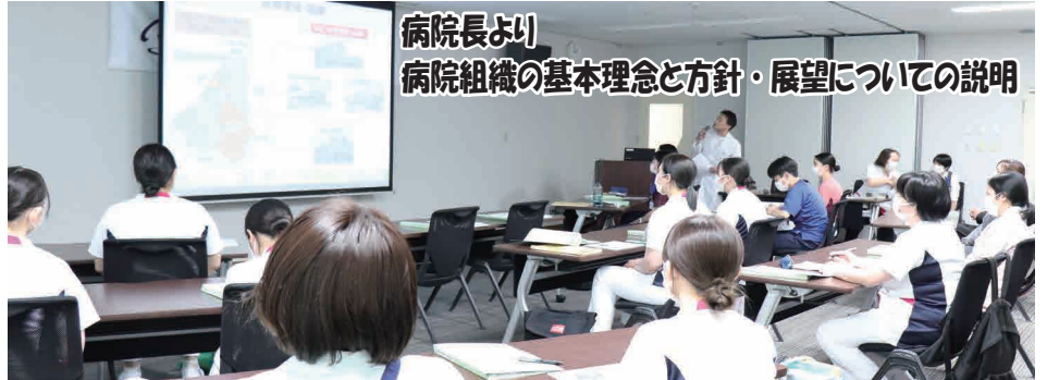
病院長より 病院組織の基本理念と方針・展望についての説明