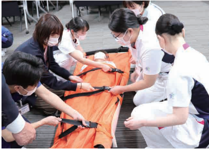
エアーストレッチャーの使い方